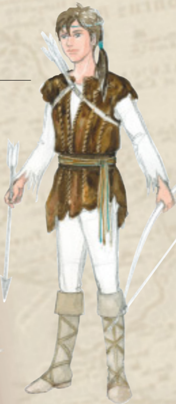
パルジファル 清き愚か者、新しい聖杯王