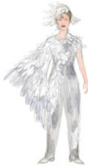
マグダレーナ パルジファルが傷つけた白鳥、実は王家の娘