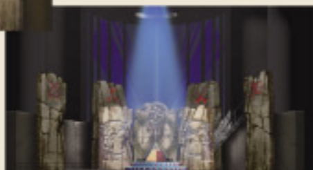
第1場 モン・サルヴァート神殿前広場