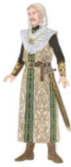
アンフォルタス 王の代行、クリングゾールとの戦いで傷を負うがパルジファルにより癒される