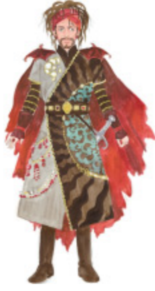
クリングゾール 邪悪な魔法使い、もとは聖杯の騎士