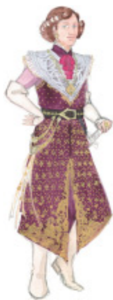
グルネマンツ 聖杯の騎士の一人、コミカルなお姉キャラ