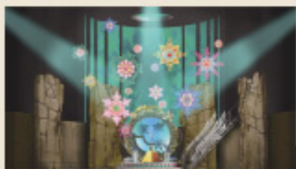
第7場2景 モン・ディアーフヴォロの廃墟 花々の咲き乱れる楽園

しかし、聖杯と聖なる槍を合体させる「聖杯の儀式」を執り行うと奇跡が起こり、白鳥のマグダレーナは瞬く間に美しい王女となってよみがえった。国民一同、新王パルジファルの誕生と后マグダレーナとの結婚を祝福し、モン・サルヴァート王国に新たな平和の時代が訪れたのであった。