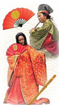
オペラ「扇的」実行委員会

瀬戸フィルハーモニー交響楽団より金管5重奏による演奏や、2024年10月に開催する新作オペラ「扇的」～青葉の笛編～出演者による一場面公開、その他ジャグリングやライブペイント、タップダンスなどのパフォーマンスをバイオリン・ギター・グラノピアノの音色と共に楽しみください。