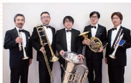
瀬戸フィルハーモニー交響楽団