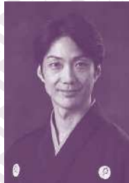
野村 萬齋 のむら まんざい

1931年生。重要無形文化財各個指定保持者（人間国宝）、文化功労者。祖父・故初世野村萬齋及び父・故六世野村万蔵に師事。3歳で初舞台。早稲田大学文学部卒業。「万作の会」主宰。軽妙洒脱かつ品格ある芸で国内外で狂言普及に貢献。ハワイ太ウシントン大では客員教授を務める。狂言の秘曲「釣狐」で芸術祭大賞を受賞。その他、紀伊國屋演劇賞、日本芸術院賞、紫綬褒章、坪内逍遙大賞、朝日賞、旭日小綬章、中日文化賞、ニューヨークジャパンセンター賞等、受賞歴多数。早稲田大学芸術功労者、練馬区名誉区民。二月に憑かれたビエロ、「千午線の祀り」「秋江」「法螺待」「敦一山月記名人伝」等、狂言師として新たな試みにもしばしば取り組み、現在に至る狂言隆盛の礎を築く。後進の指導にも尽力。練馬文化センター名誉館長。