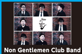
Non Gentlemen Club Band