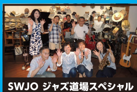
SWJO ジャズ道場スペシャル