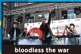
bloodless the war