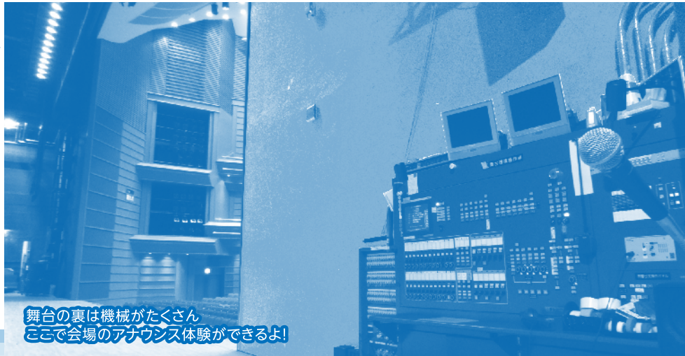
舞台の裏は機械がたくさん ここで会場のアナウンス体験ができるよ!