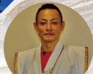
演出・構成 (主管) 野中 耀博

料金 / 一般 3,000円 高校生以下 2,000円 (全席指定、当日 500円増)