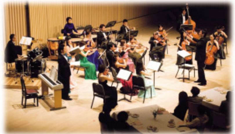
2009年度「瀬戸フィルアンサンブル ティータムコンサート」より

りと、それぞれのティータムにふさわしく、ポピュラーなクラシックをはじめ、映画音楽なども盛り込んだくつろぎのアンサンブルコンサート。響き豊かな生演奏で、贅沢なひとときをお届けします。